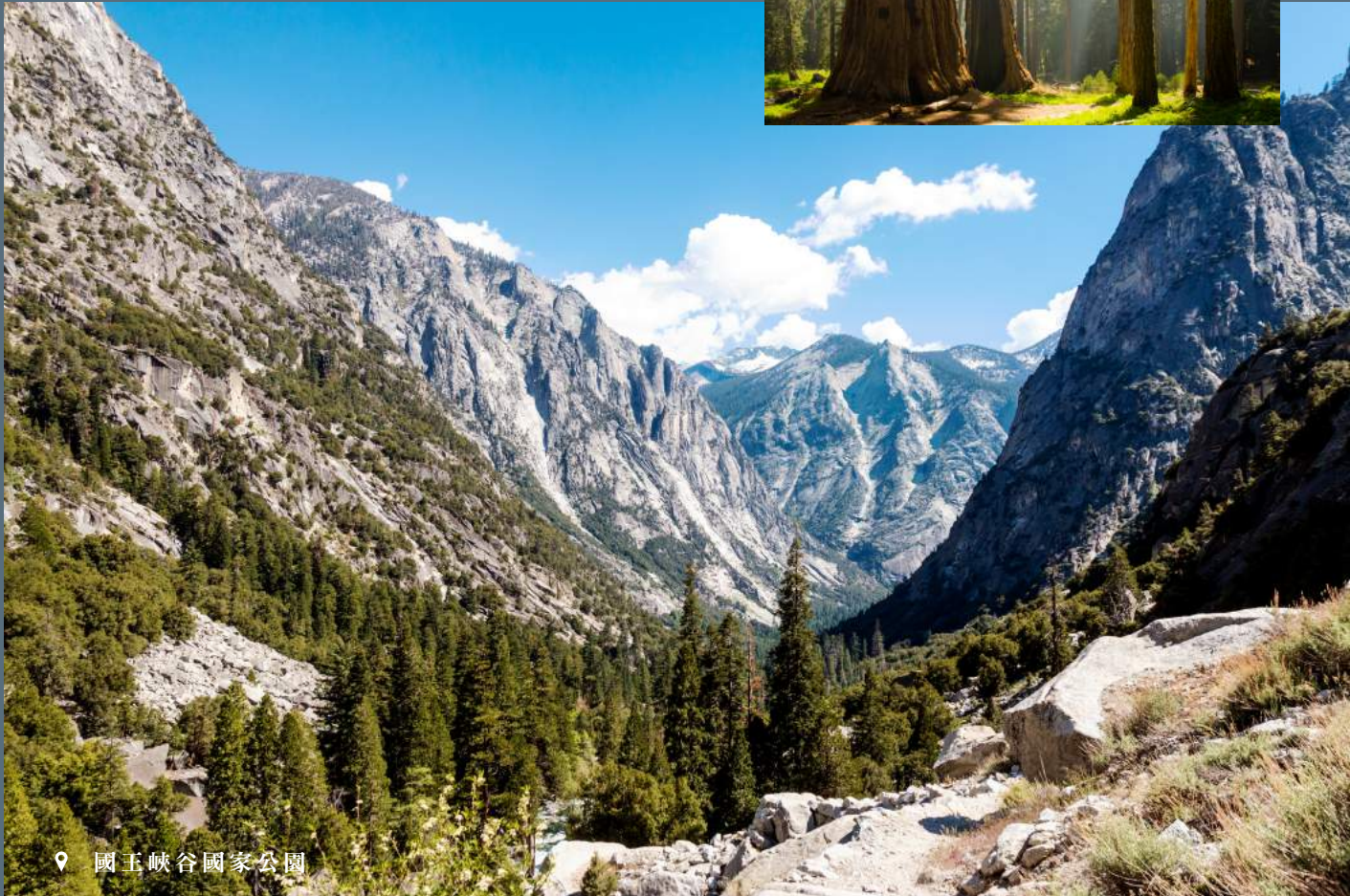
📍 國王峽谷國家公園