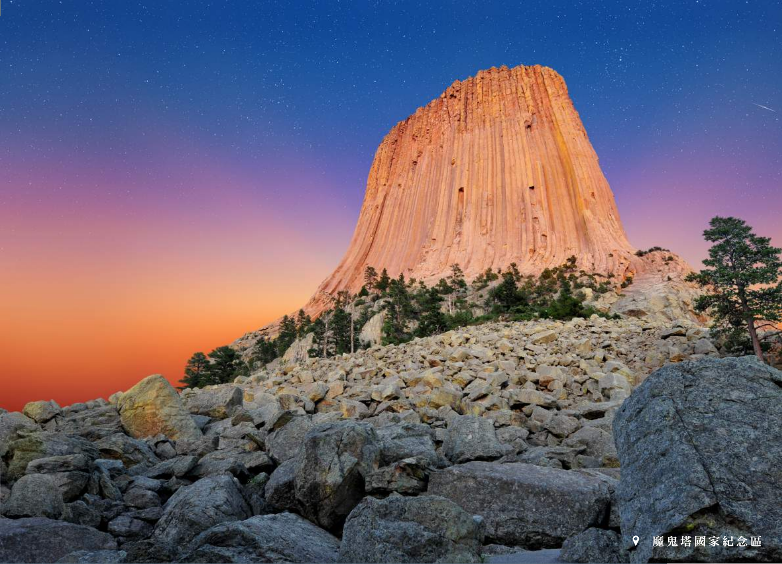
📍 魔鬼塔國家紀念區